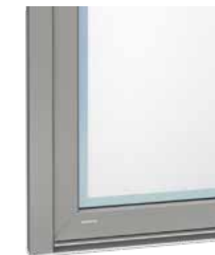
Sandgestrahlt mit klarem Rand

Die Wirkung der verschiedenen Ornamentgläser können Sie in unserem Türenkonfigurator einfach ausprobieren: